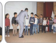
روزی که باهم بچه ها

مراسم تجلیل از فرزندان ممتاز اعضای هیات علمی و کارمندان