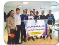
مسابقات ورزشی اعضای هیات علمی و کارکنان دانشگاه گنبد کاووس به مناسبت ایام الله دهه فجر