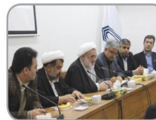
در مسیر تهذیب و تحصیل

دیدار رییس دانشگاه گنبد کاووس با خانواده معظم شهدا به مناسبت ایام الله دهه فجر و چهلمین سالگرد پیروزی انقلاب اسلامی