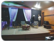
صحنه پیوسته به جاست برگزاری تئاتر دانشجویی