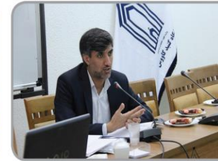
ای برادر تو همه اندیشه‌های ...