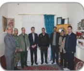
دانی که چیست دولت دیدار یار دیدن

دانشگاه گنبد کاووس در یازدهمین جشنواره بین المللی حرکت به میزبانی دانشگاه اصفهان