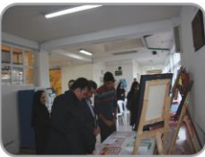
هنر آموزید که ملک و دولت دنیا اعتماد را نسازید و ... هنر در نفس خود دولت است بازدید رییس دانشگاه از نمایشگاه رویش (نمایشگاهی برای ارائه آثار هنری دانشجویان)