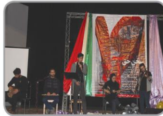
نشاط و شادابی جوانی در آیین بزرگداشت روز دانشجو