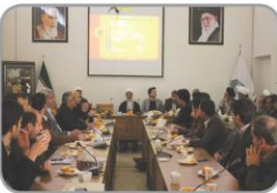
زمانی برای بارش افکار

نشست هم اندیشی با موضوع «فضای مجازی از ایجاد آسیبهای اجتماعی تا تولید سرمایه اجتماعی»