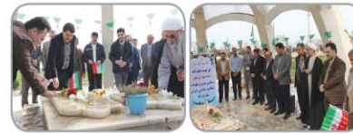
ای غبار خاک کویت سر مه چشم فلک

غباررویی و عطر افشانی مرقد مطهر شهدای گمنام دانشگاه به مناسبت دهه مبارک فجر