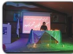
یک فینجان شعر ناب شب شعری به همت انجمن علمی زبان و ادبیات فارسی