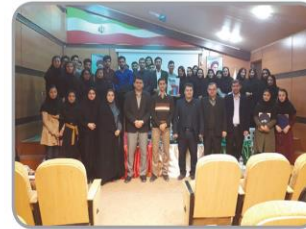
«جشنی برای اعداد»