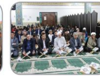
حضور خلوت انس است و دوستان جمعند

غباررویی و عطر افشانی مرقد مطهر شهدای گمنام دانشگاه به مناسبت دهه مبارک فجر