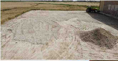
پروژه زمین تنیس