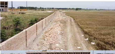
اتمام پروژه دیوار و حصار زمین دانشگاه