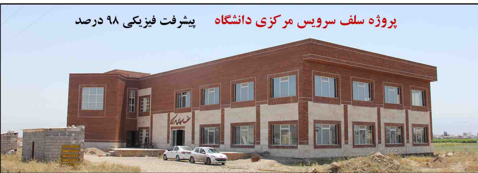
پروژه سلف سرویس مرکزی دانشگاه پیشرفت فیزیکی ۹۸ درصد