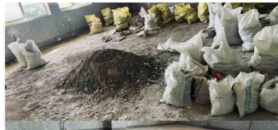
اتمام پروژه بازسازی و مقاوم سازی کلاس‌های دانشکده علوم انسانی