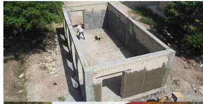
پروژه ایستگاه دوچرخه