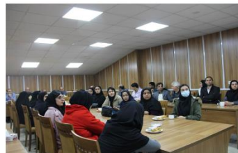
نشست علمی با موضوع "تهدیدها و فرصت‌های کاشت درخت پالونیا در شرق استان گلستان"