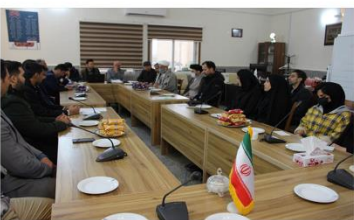
کرسی آزاد اندیشی با موضوع بررسی چالش‌ها و موانع خصوصی سازی مطلوب در ایران