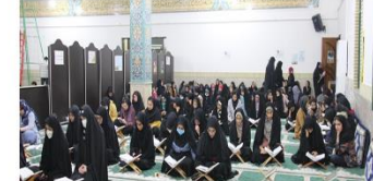
برگزاری محفل انس با قرآن کریم