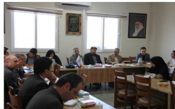
برگزاری میزگرد علمی با موضوع احیای تالاب‌های استان گلستان