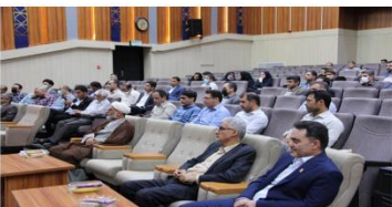
نشست هم‌اندیشی اساتید دانشگاه با موضوع گرامیداشت آغاز سال تحصیلی