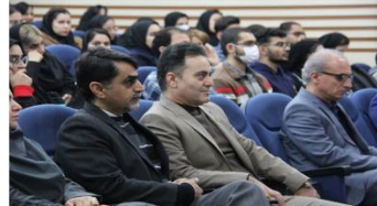
نشست عمومی جایگاه و اهمیت علوم پایه در توسعه پایدار