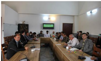
کرسی آزاد اندیشی با محوریت چشم انداز برنامه هفتم توسعه اقتصادی و اجتماعی ایران