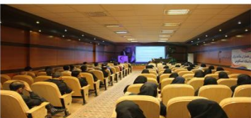
کارگاه کالاهای سلامت محور با همکاری کانون هلال احمر و همیاران سلامت